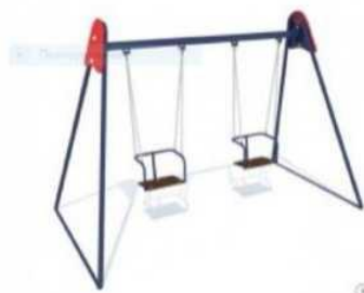
Качели двойные "КД-01"